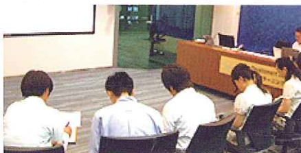
同じく世銀イベントの様子 スクリーンにはパプアニューギニア側の学生の姿が

2009年6月25日、霞山会館(東京都港区)にて、当協会理事会、総会が開かれました。