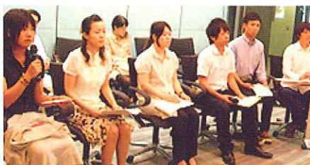
7月3日世銀イベントの様子 日本からの参加者は6名でした

特に、これから月例会において、協会員各位のお力添えを賜りたく、何卒よろしくお願ひ申し上げます。様々な立場、年代の方々がパプアニューギニアを結び目として集うこの協会は、言うまでもないことですが人材の宝庫です。その皆様のご経験から青年部メンバーが学びとる機会をいただきたいと思います。今後、青年部メンバーから講話のお願いがありましたら、どうかお断りになりませんよう、重ねてお願ひ申し上げます。